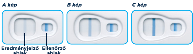
Eredményjelző ablak Ellenőrző ablak

Terhes - ha az eredmény „Terhes”, keresse fel orvosát.